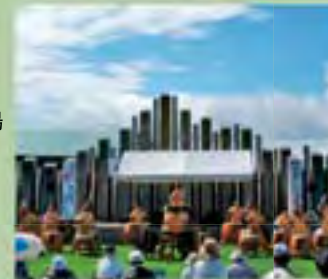
小平太鼓「麓龍」による演奏

国道231号線沿い「ゆったりかん」裏の多目的広場で行われるイベント。小平産黒毛和牛の野外パーティー用引換券が前売り券2,000円(当日券は2,300円)で味わうことができる。地元特産品が当たる大抽選会や歌謡ショーなどもあり、おおいに楽しめる。引換券は、小平町内のお店などで購入できる。