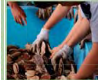
大好評！ホタテのつかみどり