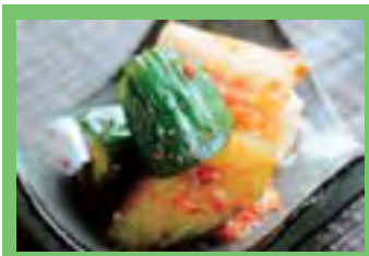
てしおキムチ工房 ... P 2