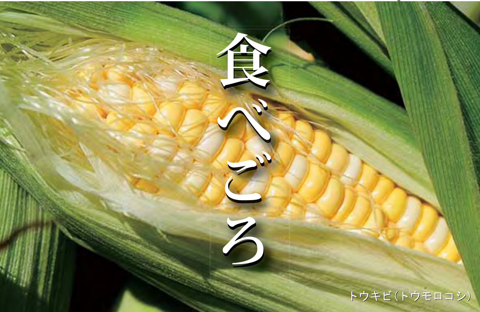
トウキビ(トウモロコシ)