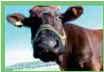
るもいフードマガジン... P 3