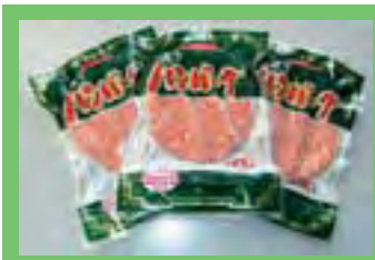
ほっぷすてっぷ ... P 3

ポッドキャスト配信中 るもいfan.net トップページ 「食の交流放送」からアクセス