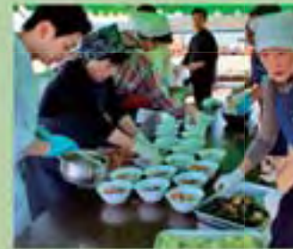
三國シェフ監修の料理も味わえる