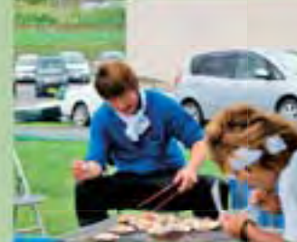
新鮮な海の幸も味わえる