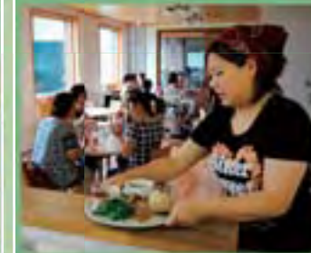
カフェテリア内の様子