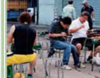
炭焼きコーナーも常設