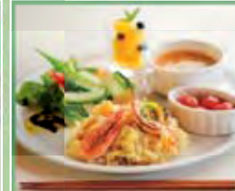
海鮮パエリアメニュー(8月6日・7日)