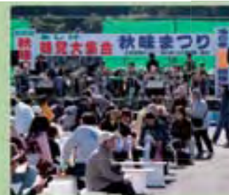
昨年の会場の様子

増毛港中央埠頭の特設会場で行われる、町内の秋の味覚が揃うまつり。地元増毛町出身、三國清三シェフ監修の料理が数量限定で味わえる。もう一つの会場「暑寒公園」隣にある「サケマス採卵場」の特設会場では、鮭のつかみ取りにチャレンジできる。