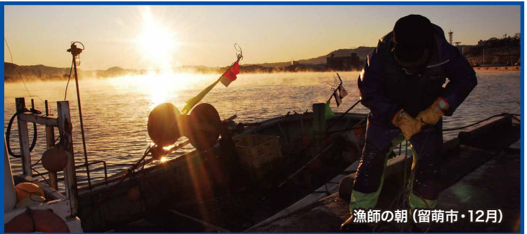
漁師の朝 (留萌市・12月)