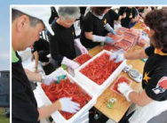
一年に一度のエビまつりで 思う存分味わいませんか！