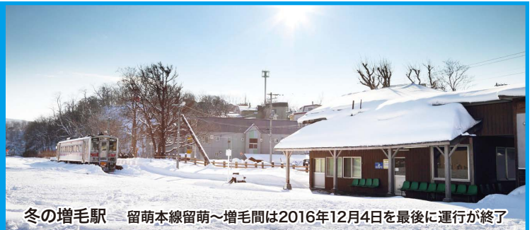
冬の増毛駅 留萌本線留萌～増毛間は2016年12月4日を最後に運行が終了